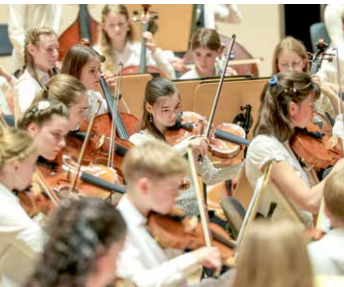
▲ Sinfonisches Musikschulorchester bei einem Konzert in der Händel-Halle

Die 20 staatlich anerkannten, kommunal getragenen Musikschulen des Landes stehen vor einer zentralen Herausforderung: demografischer Wandel im Kollegium. Mehr als die Hälfte der Lehrkräfte ist über 55 Jahre alt; der Ruhestand vieler erfahrener Pädagoginnen und Pädagogen führt zu einem landesweiten Bedarf an qualifiziertem Nachwuchs.