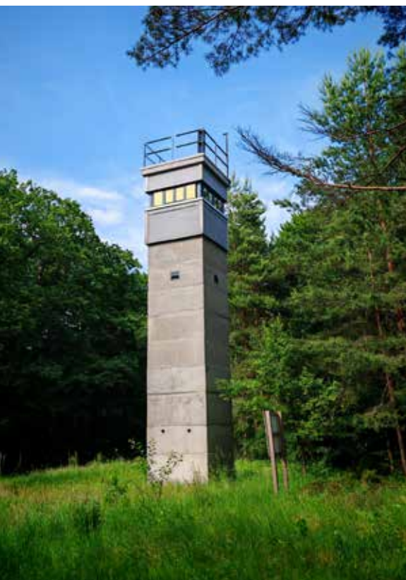
◀ Grenzturm bei Walbeck

So steht der Turm heute nicht nur als Mahnmal, sondern auch als Symbol dafür, wie bürgerschaftliches Engagement Erinnerung bewahrt und das Grüne Band lebendig hält.