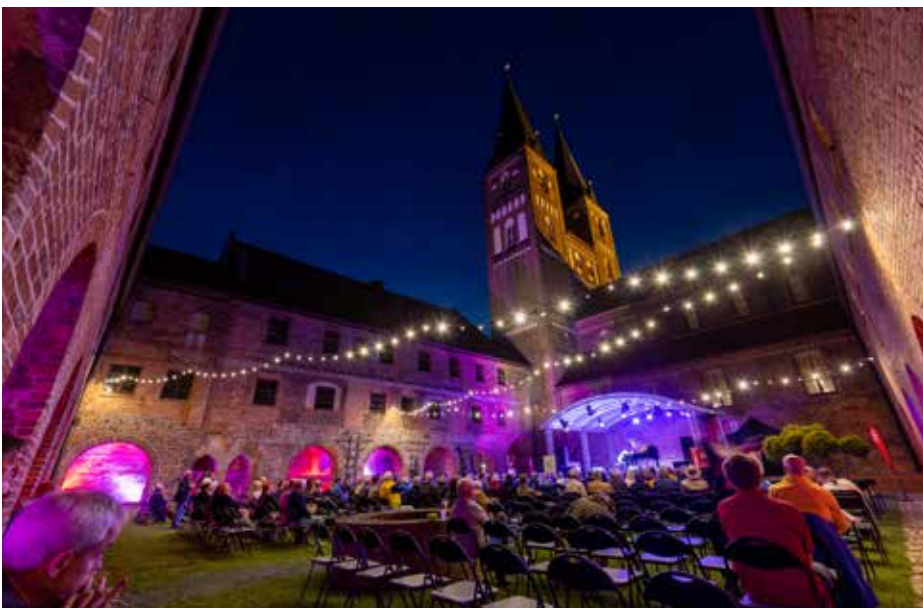
◀ Jazz im Kloster Jerichow 2023

Im Harz feierte das Theaternatur-Festival in der Waldbühne Benneckenstein 2024 sein zehnjähriges Jubiläum. Ein Erfolgsprojekt, dessen gefeiertes Programm jährlich