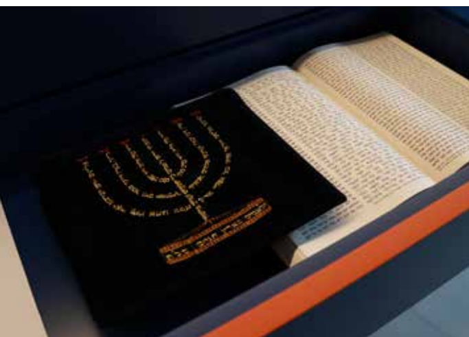
▲ Blick in die neue Dauerausstellung des Museums Synagoge Gröbzig

Sachsen-Anhalt verfügt über ein einzigartiges Netz jüdischer Erinnerungsorte, die Geschichte, Religion und Gegenwart jüdischen Lebens erfahrbar machen. Die Landesregierung hat sich in der Koalitionsvereinbarung verpflichtet, die Vermittlungsarbeit an diesen Stätten gezielt zu stärken – insbesondere in Halberstadt, Gröbzig und Dessau – und zugleich die landesweiten Jüdischen Kulturtage dauerhaft zu fördern.