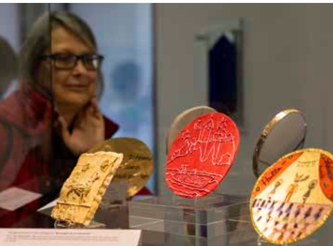
▲ Neben der Datenbank lohnt ein Blick auf das Original: Das Landesmünzkabinett

Mit dem Projekt „Systematische Erfassung sachsen-anhaltischer Münzen“ (S.E.S.A.M.) verfolgt das Landesamt für Denkmalpflege und Archäologie Sachsen-Anhalt (LDA) ein anspruchsvolles Ziel: die umfassende Digitalisierung und wissenschaftliche Erschließung von Fundmünzen aus Museen im ganzen Land. Seit dem Projektstart im Juli 2022 werden Münzbestände aus kleinen und mittleren Museen digital erfasst, beschrieben und in einheitlichen Datenformaten gesichert – ein wichtiger Schritt, um diese kulturhistorisch bedeutsamen Objekte für Forschung und Öffentlichkeit dauerhaft zugänglich zu machen.