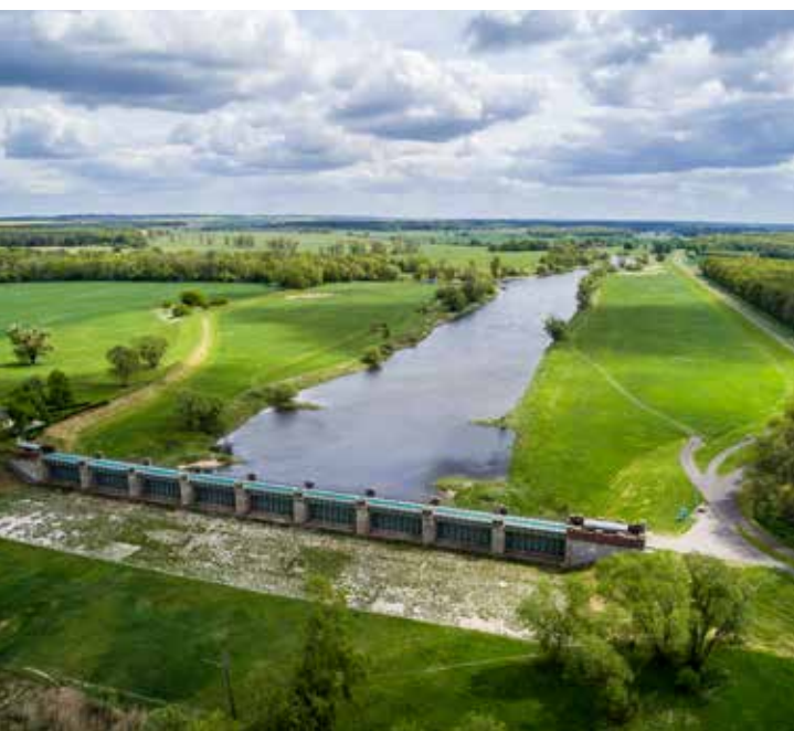
◀ Blick von oben auf das Pretziener Wehr

Das Pretziener Wehr steht für die Verbindung von technischer Funktionalität, Nachhaltigkeit und kulturellem Erbe. Der neue Verein will dieses außergewöhnliche Denkmal stärker ins Bewusstsein rücken, Bildungs- und Tourismusprojekte anstoßen und die Identifikation der Bevölkerung mit ihrer Heimat fördern – auf dem Weg zu einer möglichen neuen UNESCO-Welterbestätte in Sachsen-Anhalt.