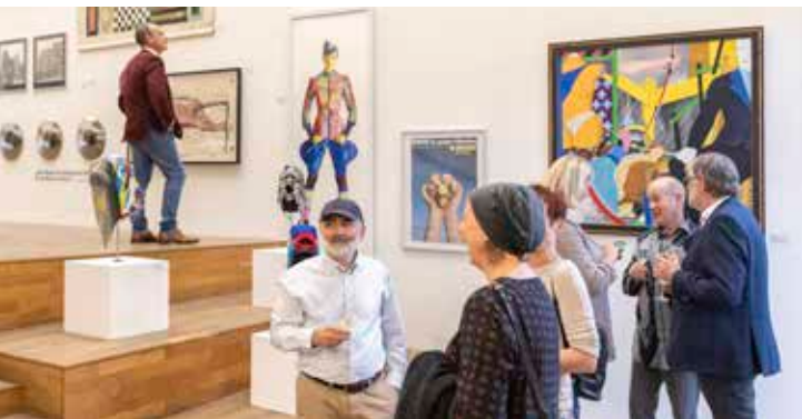
▲ Ausstellungsort war die Kunststiftung Sachsen-Anhalt

Mit der Ausstellung „Re-present“ richtete das Land Sachsen-Anhalt im Sommer 2025 den Blick auf mehr als drei Jahrzehnte staatlicher Kunstankäufe. Die Schau in der Kunststiftung Sachsen-Anhalt brachte Arbeiten unterschiedlichster Medien und Generationen zusammen und stellte sie in vielfältige Dialoge. So entstand ein Panorama künstlerischer Positionen, das Fragen nach Sichtbarkeit, Repräsentation und dem Selbstverständnis zeitgenössischer Kunst im Land neu verhandelte.