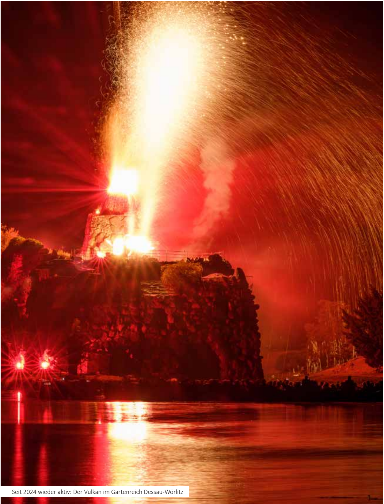
Seit 2024 wieder aktiv: Der Vulkan im Gartenreich Dessau-Wörlitz