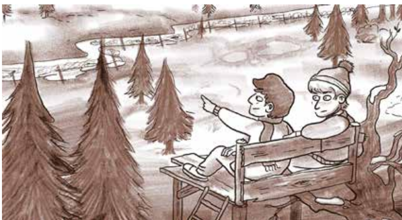
▲ Ausschnitt aus dem Motion Comic „Kein Wiedersehen“ von Livia Brocke

MoComs sind mehr als digitale Erzählformate – sie sind ein kreatives Werkzeug moderner Erinnerungskultur. Sie sprechen Jugendliche unabhängig von Herkunft oder Vorwissen an und eröffnen niedrigschwellige, zugleich anspruchsvolle Zugänge zu historischen Themen.