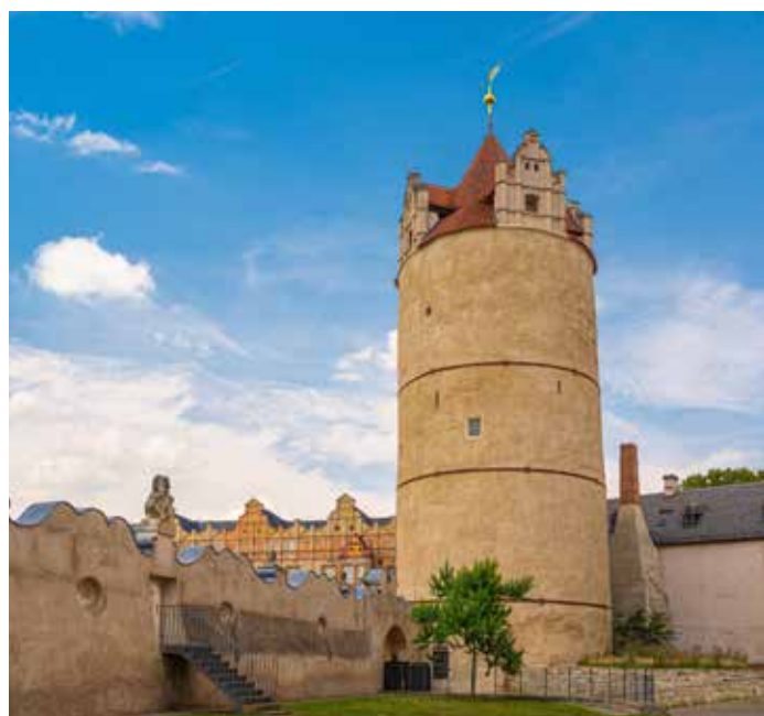
▲ Der Aufgang des Eulenspiegelturms in Bernburg wurde als erste Maßnahme fertiggestellt

Für das Sonderinvestitionsprogramm 1 stellen Bund und Land Sachsen-Anhalt jeweils 100 Millionen Euro bereit. Mit den insgesamt 200 Millionen Euro werden bis 2032 an zehn Liegenschaften der Kulturstiftung 19 Teilmaßnahmen umgesetzt. Im Mittelpunkt stehen der konsequente Abbau von Sanierungsrückständen und die Anpassung der Nutzung an heutige Anforderungen. Zu den herausragenden Projekten zählen die statische Ertüchtigung der Kernburg von Burg Falkenstein, der Ausbau der Vorkernburg auf Schloss Neuenburg in Freyburg (Unstrut) sowie – als größte Einzelmaßnahme – der Neubau eines Zentraldepots für die umfangreichen Sammlungsbestände, insbesondere des Kunstmuseums Moritzburg Halle (Saale).