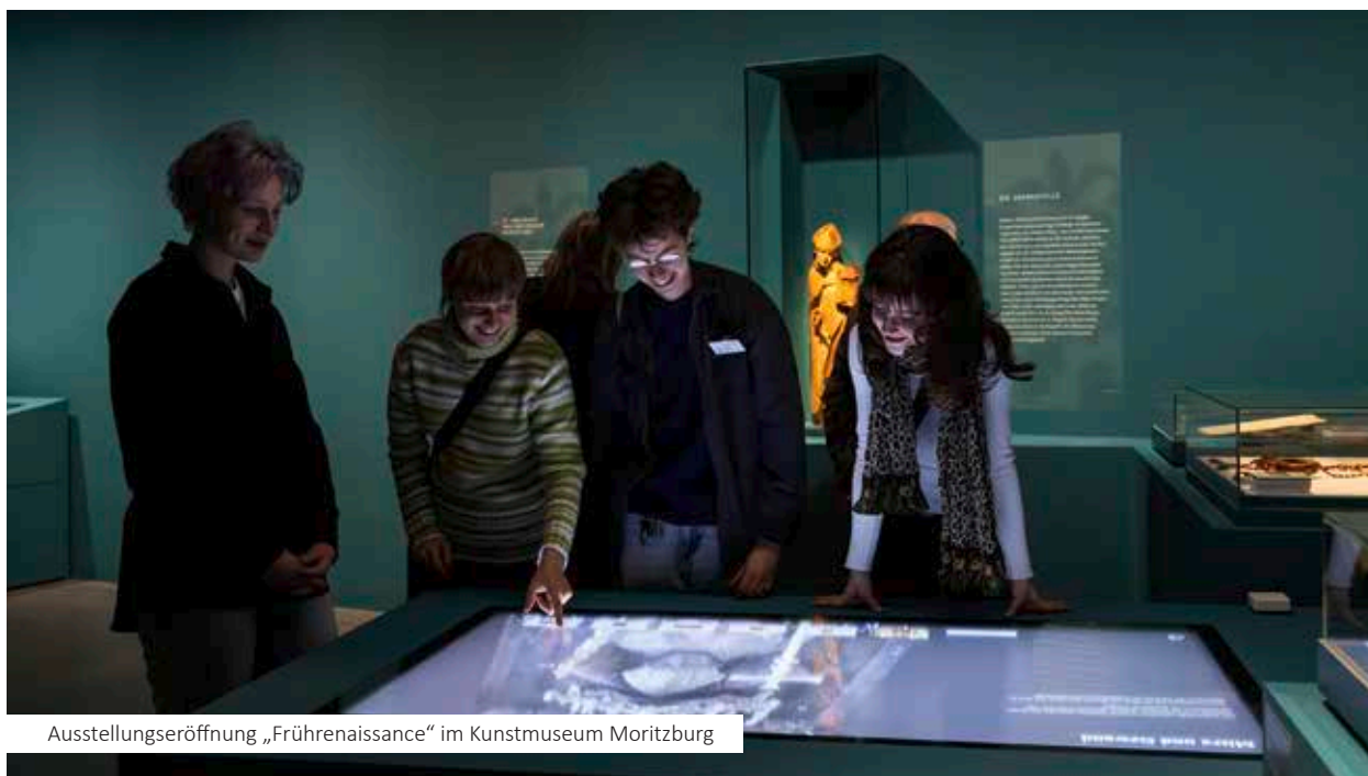
Ausstellungseröffnung „Frührenaissance“ im Kunstmuseum Moritzburg

Das Kunstmuseum Moritzburg Halle (Saale) hat sich von 2021 bis 2025 mit großen Sonderausstellungen – von Frührenaissance und Bauernkrieg bis zu moderner und zeitgenössischer Kunst – als profilstarke Landesmuseum präsentiert. Mit nationalen und internatio-