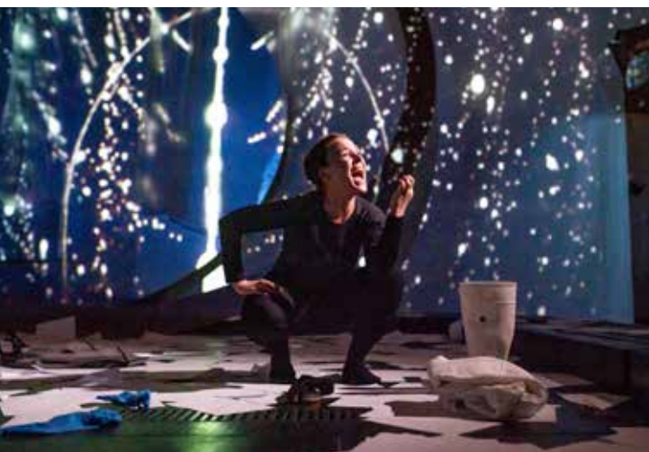
▲ Stanisław Lems „Solaris“, eine Inszenierung von Künstlerische Intelligenz, 2023

Die Freie Szene in Sachsen-Anhalt hat sich in den vergangenen Jahren zu einem zentralen Bestandteil der Kulturlandschaft entwickelt. Mit ihr verbindet sich künstlerische Vielfalt, Experimentierfreude und gesellschaftliche Relevanz – zugleich bleibt sie stark von individuellen Arbeitsrealitäten und prekären Strukturen geprägt. Das Land hat deshalb Maßnahmen entwickelt, die über die klassische Projektförderung hinauswirken und die Arbeitsbedingungen freier Künstlerinnen und Künstler verbessern.