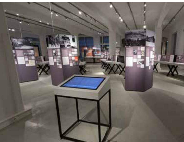
▲ Ausstellung im Stadtmuseum Halle (Saale) 2024

Von 2020 bis 2023 erarbeitete die Gedenkstätte Roter Ochse Halle (Saale) der Stiftung Gedenkstätten Sachsen-Anhalt gemeinsam mit Partnereinrichtungen aus mehreren europäischen Ländern die Wanderausstellung „Das Reichskriegsgericht 1936-1945. Nationalsozialistische Militärjustiz und die Bekämpfung des Widerstands in Europa“. Das Projekt beleuchtete das Reichskriegsgericht (RKG) in seiner ganzen historischen Tragweite und bezog vor allem die Familien der Verurteilten aus Polen, Frankreich, Belgien, den Niederlanden, Norwegen, Tschechien und Österreich mit ein. Es verfolgte einen transnationalen Ansatz, der den Blick auf die europäische Dimension der NS-Militärjustiz schärfen sollte.