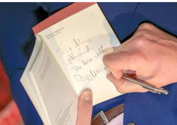
▲ Der Schriftsteller Domenico Müllensiefen signiert ein Buch anlässlich der Verleihung des Klopstock-Förderpreises 2023

Von Klopstock über Novalis bis Brigitte Reimann – viele große Stimmen der deutschen Literatur haben in Sachsen-Anhalt ihre Wurzeln. Dieses Erbe wirkt fort und prägt das literarische Selbstverständnis bis heute. Zugleich ist im Land eine lebendige Gegenwartsszene entstanden, die das kulturelle Profil Sachsen-Anhalts maßgeblich mitgestaltet.