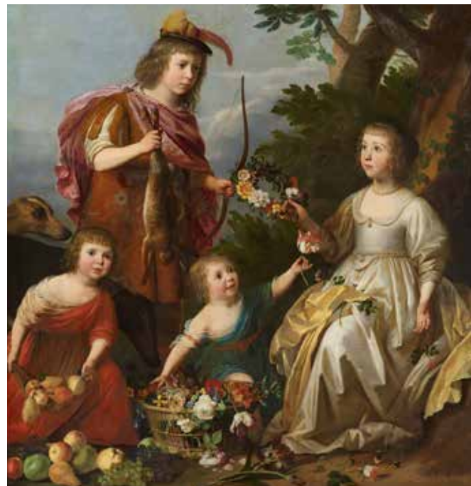
▲ Gerrit van Honthorst „Prinz Wilhelm von Oranien-Nassau“ kehrte nach Wörlitz zurück

Ein großer Glücksfall war der Erwerb von Gerrit van Honthorst's Gemälde „Prinz Wilhelm von Oranien-Nassau und drei seiner Schwestern“ für die Kulturstiftung Dessau Wörlitz. Das großformatige Gemälde von 1635 muss