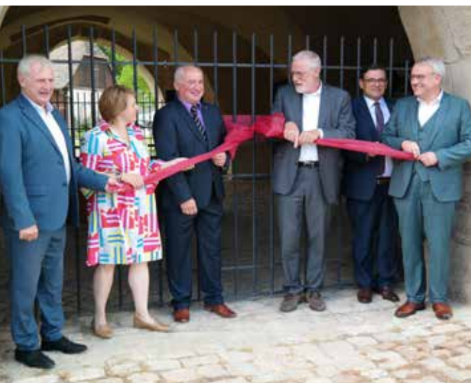
◀ Festakt zur Verleihung des Europäischen Kulturerbe-Siegels

Darüber hinaus fördert das Land auch weiterhin die Entwicklung und Erschließung der Klosterlandschaft an Saale und Unstrut. So ist bereits ein Rundwanderweg zu den Stätten der Zisterzienser fertiggestellt worden. Auch der Garten des Meisters mit dem von den Zisterziensern eingeführten Borsdorfer Apfel nimmt schrittweise Gestalt an.