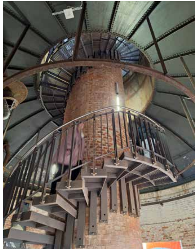
▲ Wasserturm Salbke Magdeburg

Ein wichtiger Schritt war die Veröffentlichung des Online-Portals www.industriekultursachsen-anhalt.de , das Ende 2024 online ging. Es bündelt Wissen, Geschichten und Materialien und macht die Vielfalt der Industriekultur digital erlebbar. Der weitere Ausbau des Portals zu einem Wissensspeicher mit Zeitzeugenarchiv ist in Bearbeitung.