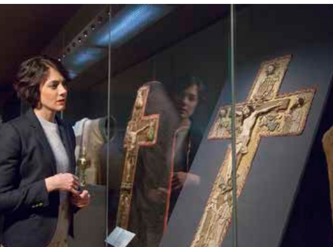
▲ National wertvoll: Der Domschatz Halberstadt

Mit einem Festakt im Halberstädter Dom feierte die Kulturstiftung Sachsen-Anhalt im Sommer 2023 die Eröffnung des neuen Besucherzentrums Dom | Schatz. Die moderne Anlaufstelle auf der Nordseite des Doms bildet seitdem den Auftakt für den Besuch des weltweit größten mittelalterlichen Domschatzes außerhalb des Vatikans. Im Rahmen der Feierlichkeiten verkündete Staats- und Kulturminister Rainer Robra die Aufnahme des Halberstädter Domschatzes in die Liste national wertvollen Kulturguts: „Der Halberstädter Domschatz ist von herausragendem Erhaltungswert. Nicht nur unter Mediävistinnen und Mediävisten gilt er als Ensemble von Weltrang. Für unsere Geschichte und Identität ist der Halberstädter Domschatz prägend.“ Damit gehört der einzigartige Domschatz nun offiziell zu den wichtigen Zeugnissen der Menschheit, die in ihrer Bedeutung identitätsstiftend für die Kultur Deutschlands sind.