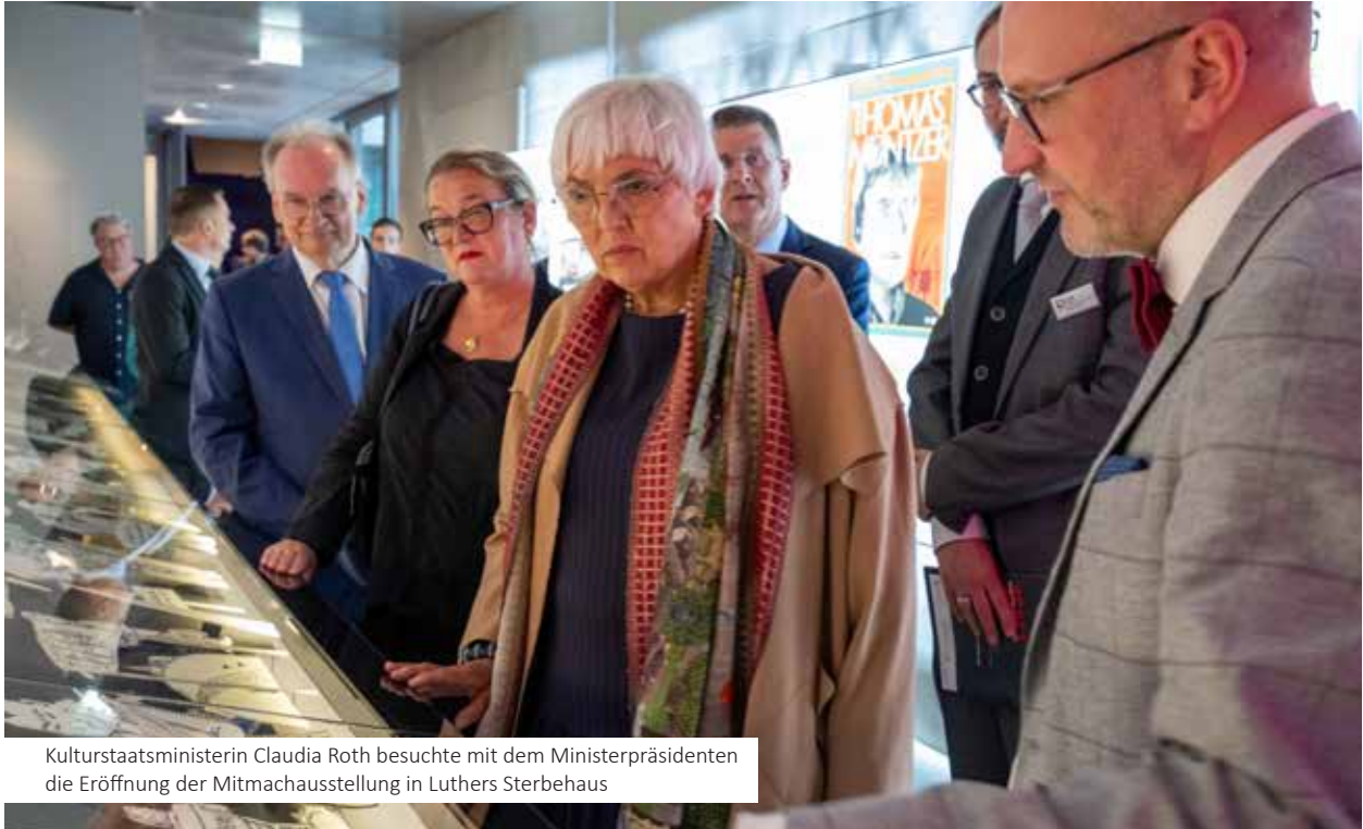
Kulturstaatsministerin Claudia Roth besuchte mit dem Ministerpräsidenten die Eröffnung der Mitmachausstellung in Luthers Sterbehaus

um 1500 in ihrer ganzen Vielfalt gezeigt – in einer Zeit tiefgreifender gesellschaftlicher, religiöser und politischer Umbrüche.