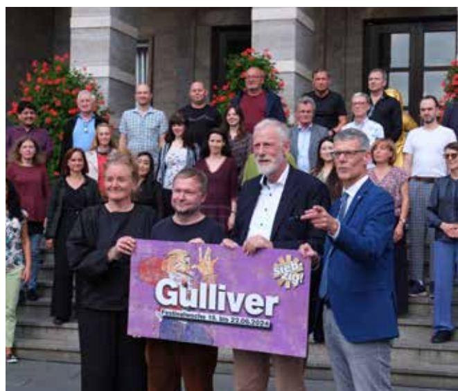
▲ Festakt 70 Jahre Puppentheater in Halle (Saale)

Das Puppentheater steht für eine unverwechselbare Ästhetik: Handgefertigte Stab-, Hand- und Klappmaulpuppen, filigrane Schattenfiguren und der charakteristische „Vierfüßler“, der von zwei Spielern zugleich geführt wird und dessen Ausdruckskraft weltweit Beachtung findet. Internationale Koproduktionen, etwa mit den Wiener Festwochen, dem Schauspielhaus Köln oder