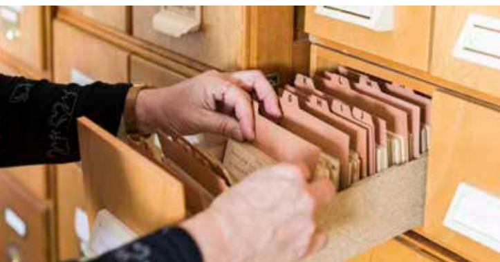
▲ Provenienzforschung: Blick in die Vergangenheit

Seit ihrer Einrichtung im Jahr 2019 hat sich die Koordinierungsstelle Provenienzforschung Sachsen-Anhalt (KoP) beim Museumsverband Sachsen-Anhalt zu einer zentralen Ansprechpartnerin für die Herkunftsforschung an Museen im Land entwickelt. Was zunächst mit dem Schwerpunkt auf NS-Raubgut begann, hat sich längst zu einem breiteren Arbeitsfeld ausgeweitet: Heute umfasst die Arbeit der Koordinierungsstelle auch koloniale Kontexte sowie Kulturgutentziehungen in der SBZ und DDR – Themenfelder, die seit einigen Jahren zunehmend auch auf Bundesebene verankert sind.