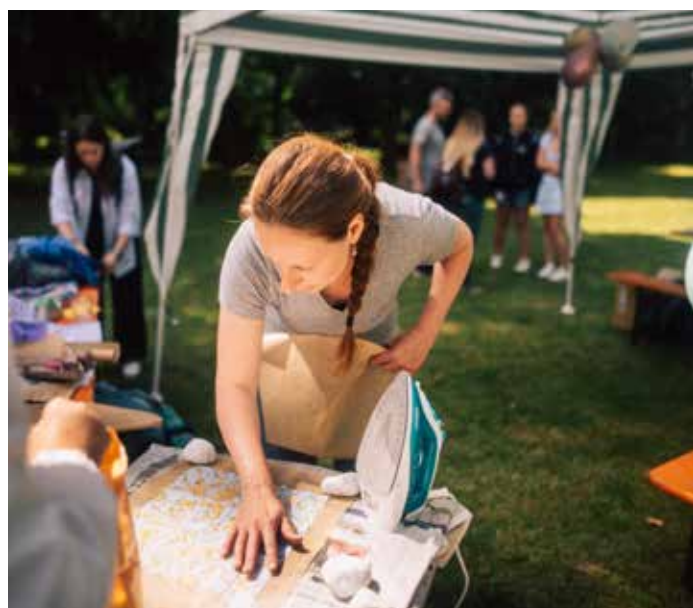
▲ Workshop anlässlich der Verleihung des Kinder- und Jugendkulturpreises 2024 in Roßla 2023

Ein weiterer Eckpfeiler ist der Kinder- und Jugend-Kultur-Preis des Landes. Er würdigt das kreative Schaffen junger Menschen in allen Sparten. Eine Fachjury bewertet die Beiträge, verliehen werden Preise im Gesamtwert von 6.500 Euro durch den Kulturminister. Nach pandemiebedingter Pause konnte der Preis ab 2022 wieder