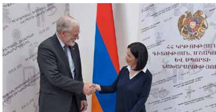
▼ Treffen mit der armenischen Ministerin für Bildung, Wissenschaft, Kultur und Sport, Zhanna Andreasyan