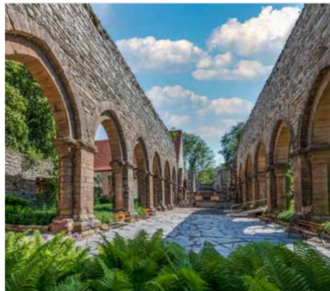
▲ Pfalz und Kloster Memleben, Sterbeort König Ottos I.

In Memleben, Ottos Sterbeort, widmete sich das Museum Kloster und Kaiserpfalz unter dem Titel „Des Kaisers Herz – Archäologische Tiefenfahndung am Sterbeort Ottos des Großen“ den neuesten wissenschaftlichen Erkenntnissen zu Kaiser Otto und seiner Zeit. Fachvorträge, Sonderführungen und Workshops eröffneten Besucherinnen und Besuchern neue Perspektiven auf das ottonische Erbe. Auch Merseburg und Quedlinburg beteiligten sich mit Ausstellungen, Figurentheater, Urkundenschauen und Führungen zu ottonischen Schauplätzen an der Festreihe. Die Vielzahl der Veranstaltungen machte sichtbar, wie eng die Ge-