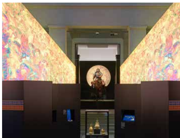
▲ Blick in die Ausstellung „Reiternomaden“

2023 bot die Ausstellung „Reiternomaden in Europa – Hunnen, Awaren, Ungarn“ (16. Dezember 2022 bis 25. Juni 2023) erstmals eine vergleichende kulturgeschichtliche Betrachtung frühmittelalterlicher Steppenvölker. Herausragende Leihgaben aus Mittel- und Südosteuropa zeigten die militärische, soziale und kulturelle Bedeutung dieser mobilen Herrscharen, deren Einfluss weit über das Karpatenbecken hinausreichte und auch Mitteldeutschland mehrfach prägte. Die Kooperation mit der Schallaburg (Österreich) verknüpfte aktuelle Forschung zu Migration, Identität und kulturel-