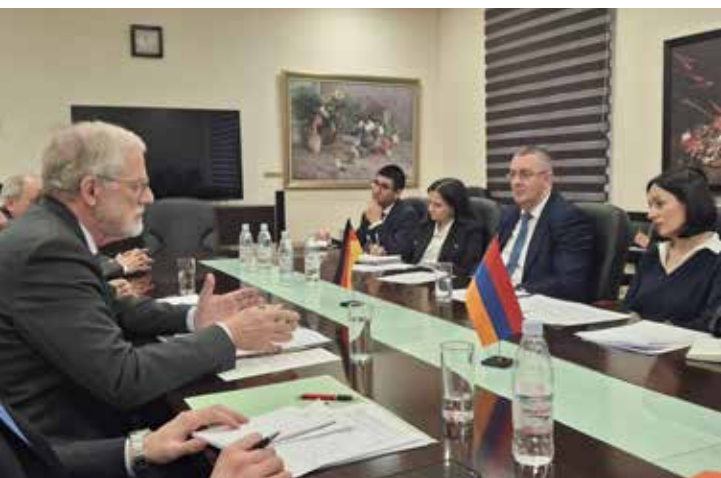
▲ Armenienreise 2025

Um den kulturellen Reichtum Sachsen-Anhalts international sichtbar zu machen und zugleich das kulturelle Leben im Land zu bereichern, fördert die Landesregierung kontinuierlich den europäischen und internationalen Kulturaustausch. Im Mittelpunkt stehen dabei langfristige Kooperationen mit den Partnerregionen und Schwerpunktländern, die den Dialog zwischen Institutionen, Künstlerinnen und Künstlern sowie Kulturakteuren nachhaltig stärken.